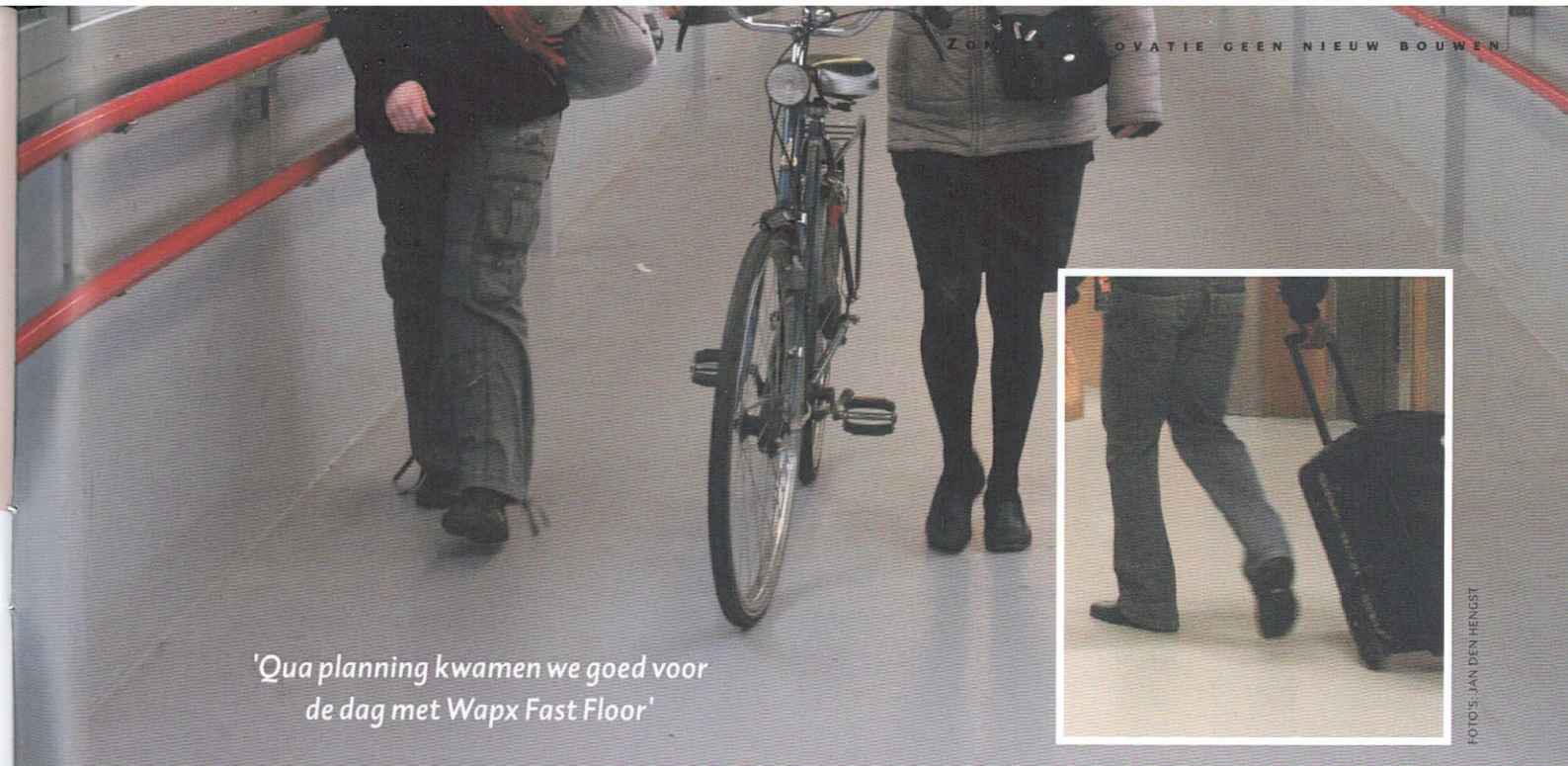
'Qua planning kwamen we goed voor de dag met Wapex Fast Floor'

Centraal Station Maastricht heeft de Passerel: een overkapte brugovergang boven de sporen. Het is een dertig jaar oude stalen constructie waarin een betonnen vloer is gestort. Deze voetgangersvoorziening was in de loop der tijd sterk vervuild, onder andere door kauwgomresten. Bovendien lieten