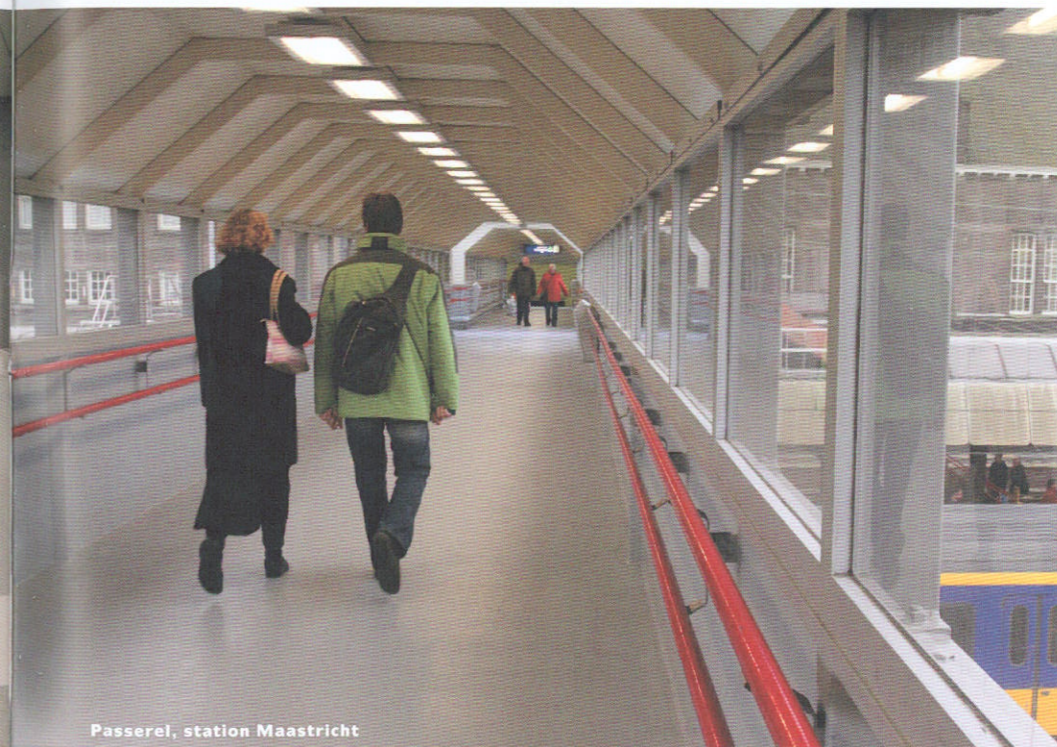
Passerel, station Maastricht

enkele vloerdelen los en was er een probleem met de aansluiting tussen stalen wand en betonnen vloer. Renovatie van de Passerel werd uitgevoerd door Wessels Vastgoed Onderhoud. Bedrijfsleider Wil Meevissen: 'Tussen wand en vloer was corrosie ontstaan. De dagelijkse machinale schrobbeurt had de coating van de opstaande stalen kant ook geen goed gedaan. NS/ProRail besloot tot renovatie, net op het moment dat wij de demo binnen hadden van Wapex Fast Floor. Ik kon dus met overtuiging zeggen dat er een perfect systeem was dat je op een en dezelfde dag kon aanbrengen en belopen. Eerst hebben we de vloer met Wapex 333 MCT behandeld. Twee dagen later hebben we 's nachts tussen twaalf en vier de coating aangebracht met Wapex Fast Floor. Qua planning kwamen we daar goed mee voor de dag.'