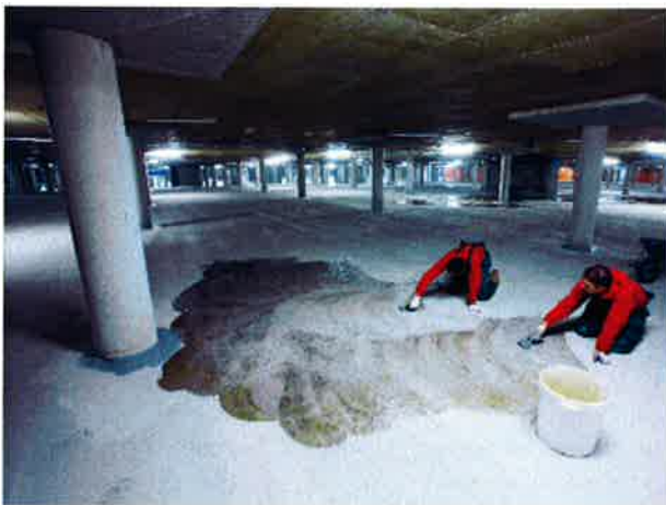
Aanbrengen kunststof vloerafwerkingen.