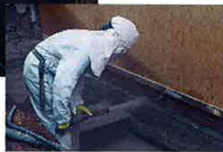
Aanbrengen van spuitbeton.

deel dat de beide bedrijven veel op elkaar lijken en veel raakvlakken hebben. En dan heb ik het niet alleen over de werkzaamheden die we ontplooiën, maar tevens over de noordelijke gedrevenheid die ook buiten de regio zo aanspreekt, de focus op kwaliteit, veiligheid en opleiding alsmede de betrokkenheid van het personeel. Het verloop binnen beide organisaties is vrijwel nihil. Men wil hier graag werken.'