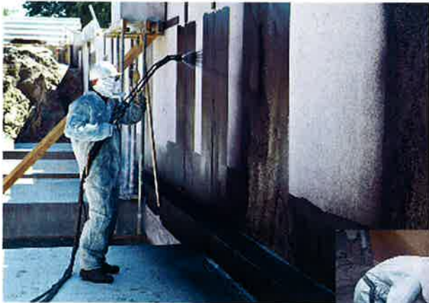
Aanbrengen van kelderafdichting.