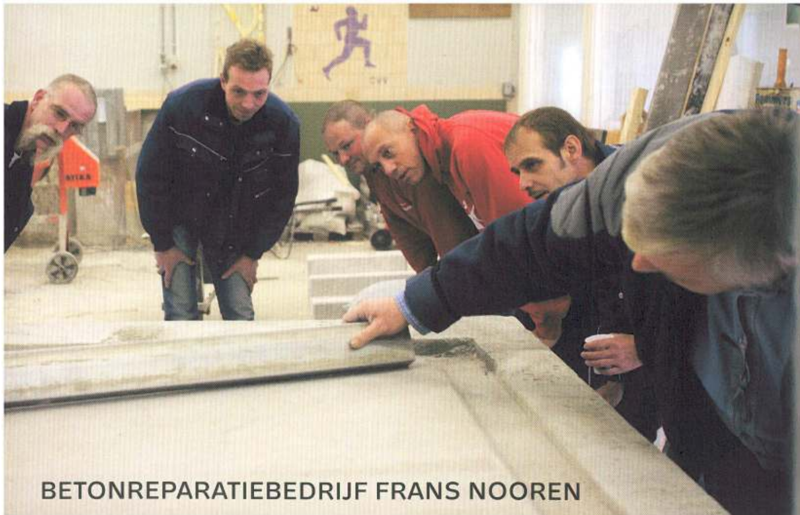
BETONREPARATIEBEDRIJF FRANS NOOREN