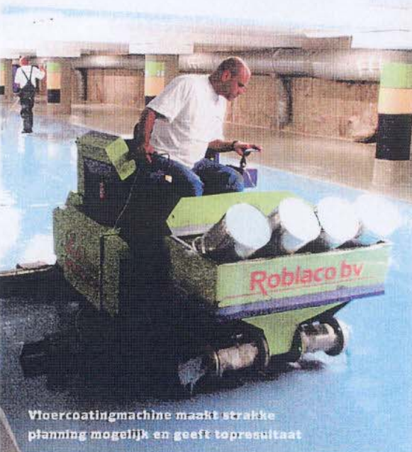
Vloercoatingmachine maakt strakke planning mogelijk en geeft topresultaat